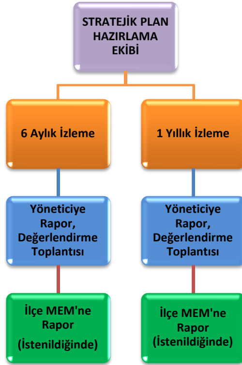
Şekil 3: İzleme ve Değerlendirme Süreci

Müdürlüğümüzün 2019-2023 Stratejik Planı İzleme ve Değerlendirme sürecini ifade eden İzleme ve Değerlendirme Modeli hazırlanmıştır. Müdürlüğümüzün Stratejik Plan İzleme-Değerlendirme çalışmaları eğitim-öğretim yılı çalışma takvimi de dikkate alınarak 6 aylık ve 1 yıllık sürelerde gerçekleştirilecektir. 6 aylık sürelerde İlçe Milli Müdürlüğüne rapor hazırlanarak sunulacaktır. İzleme-değerlendirme raporu, istenildiğinde İlçe Milli Müdürlüğüne gönderilecektir. 1 yıllık izleme-değerlendirme çalışmaları, Stratejik Planımızda yer alan hedeflerin yıllık düzeyde ifade edildiği Performans Programı ve yılsonunda gerçekleşme düzeylerinin belirlendiği Faaliyet Raporu hazırlanarak yapılacaktır. Performans Programı ve Faaliyet Raporu İlçe Milli Müdürlüğü değerlendirmesine sunulacaktır.